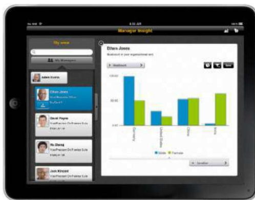
Рисунок 2. Пример реализации мобильного решения SAP Human Capital Management

Рост числа мобильных приложений, безусловно, связан с популярностью и разнообразием смартфонов, планшетных компьютеров и прочих мобильных устройств. Одним из преимуществ использования мобильных решений является обеспечение доступа к удаленным информационным системам компании через мобильный интернет. Под достоинству оценить преимущество мобильных программ могут сотрудники, часто находящиеся вне офиса.